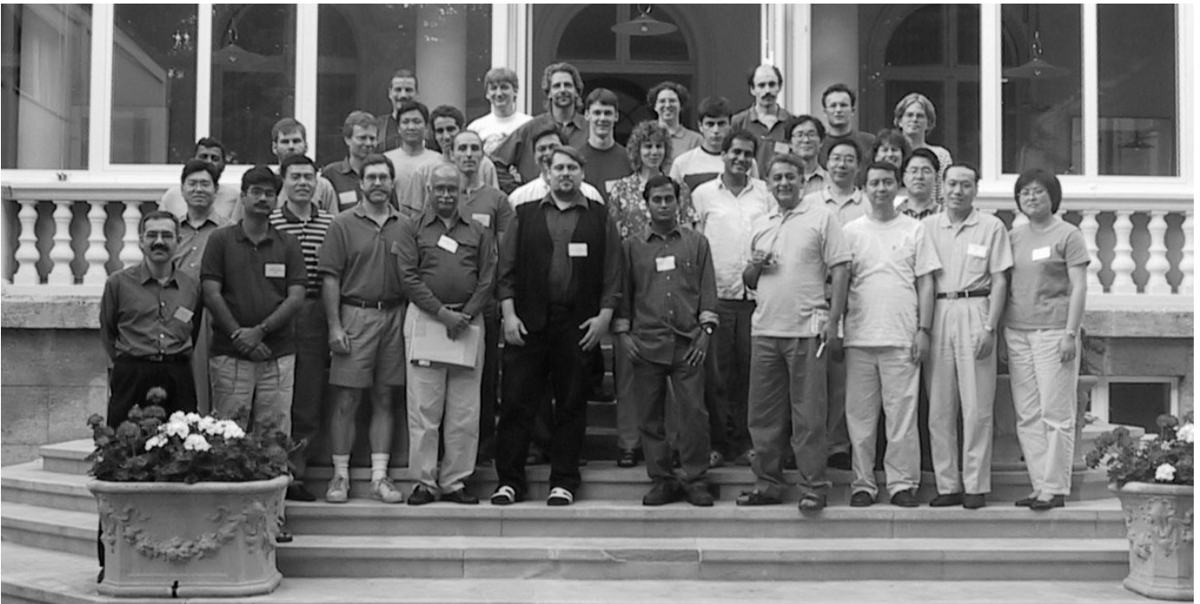
Teilnehmer(innen) des "13 th Summer Symposium on Science and World Affairs" vom 21.-30.07.2001 in der Europäischen Akademie in Berlin (Angaben zum Bild siehe Rückseite)

Forschungsverbund Naturwissenschaft Abrüstung und internationale Sicherheit