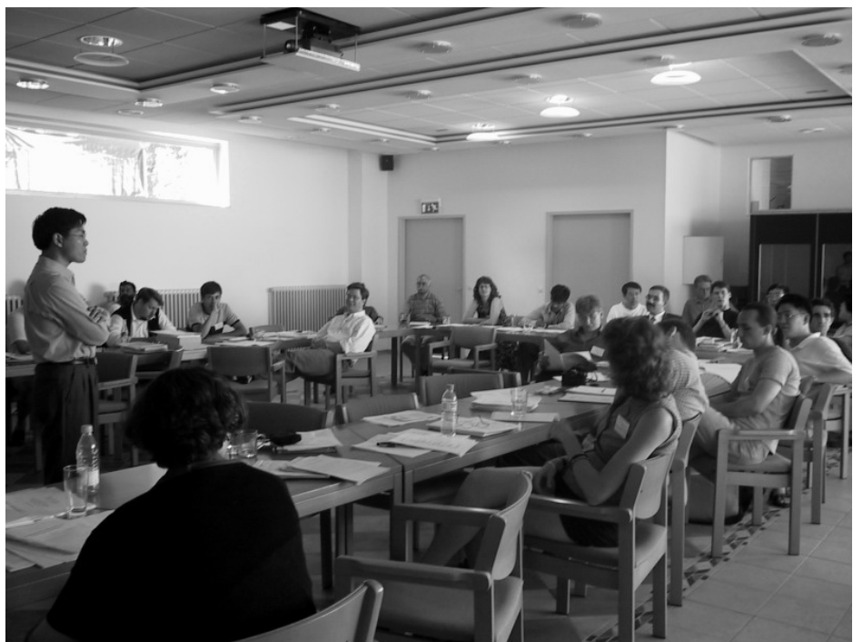
Blick in den Seminarraum

Seit dieses Symposium 1989 erstmals durchgeführt wurde, fand es in Russland, den USA, China, Deutschland und der Ukraine statt. Mehr als 200 Wissenschaftler aus Belarus, GB, China, Deutschland,